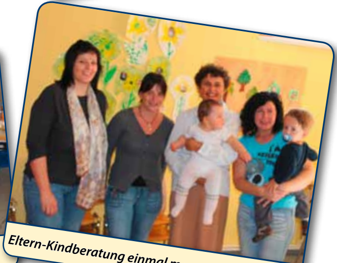
Eltern-Kindberatung einmal monatlich