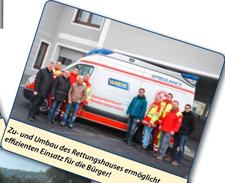
Zu- und Umbau des Rettungshauses ermöglicht effizienten Einsatz für die Bürger!