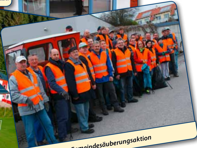
Stopp Littering - Gemeindegäuberungsaktion

wie du. für dich. friedrich. ein Bürgermeister für alle