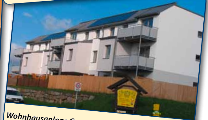
Wohnhausanlage Getreidegasse Mit der Fertigstellung des ersten Bauabschnittes, konnten zwölf neue MieterInnen die qualitativ hochwertigen Wohnungen beziehen und in unsere Gemeinschaft aufgenommen werden.

wie du. für dich. friedrich. ein Bürgermeister für alle