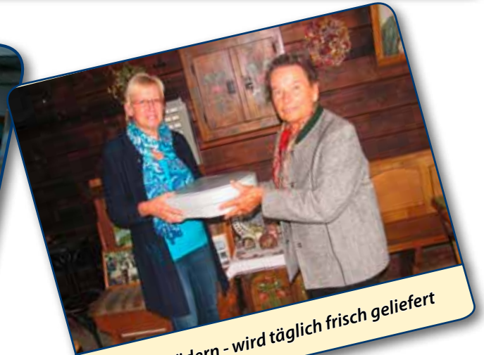
Essen auf Rädern - wird täglich frisch geliefert