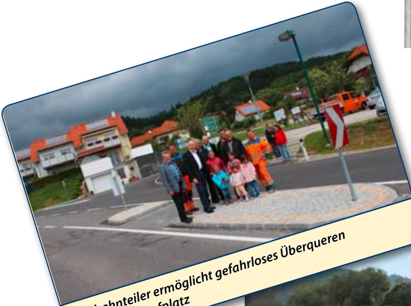
Fahrbahnteiler ermöglicht gefahrloses Überqueren der B36 am Dorfplatz