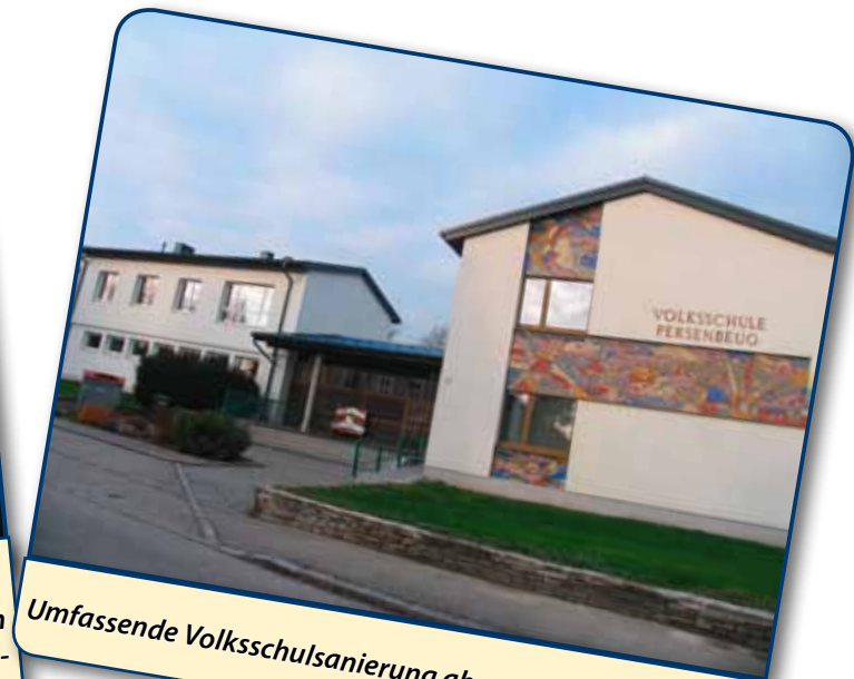
Umfassende Volksschulsanierung abgeschlossen