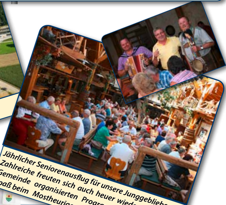
Jährlicher Seniorenausflug für unsere Junggebliebenen Zahlreiche freuten sich auch heuer wieder am von der Gemeinde organisierten Programm. Und hatten viel Spaß beim Mostheurigen in Perg