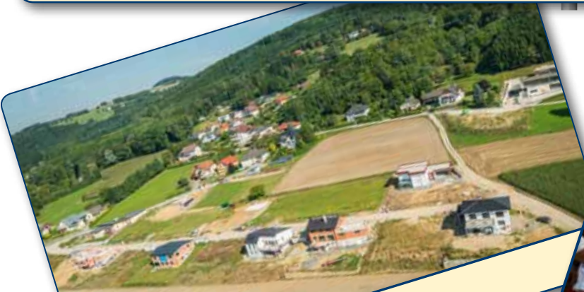
Neue Bauplätze - der Sonnenplatz wächst...

LEBENSQUALITÄT – Jeder Tag ist etwas Besonderes!