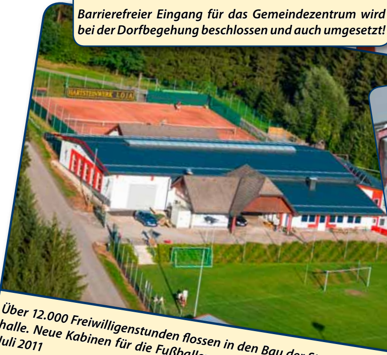
Über 12.000 Freiwilligenstunden flossen in den Bau der Stocksport- und Veranstaltungshalle. Neue Kabinen für die Fußballer wurden ebenfalls geschaffen. Eröffnungsfeier im Juli 2011