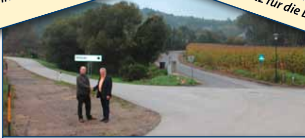
Sichtberme Kreuzung Holzian - Teichstraße - Fürholz- zeile sorgt für mehr Sicherheit!