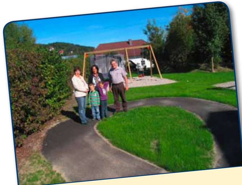
Kindergartenspielplatz neu gestaltet Der Spielplatz wurde gemäß den Vorschlägen und Plänen von pädagogischen Fachleuten neu gestaltet. Für die Verkehrs- früherziehung wurde eine Achterbahn installiert.