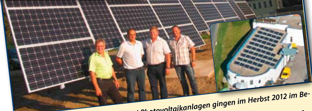
Wir nutzen die Sonnenenergie -Zwei Photovoltaikanlagen gingen im Herbst 2012 im Betrieb Für die Kläranlage Weins wurde eine nachgeführte und für das Gemeindezentrum ein fixe Anlage von der Firma Wüsterstrom montiert. Die nicht benötigte Energie wird ins Stromnetz gespeist.