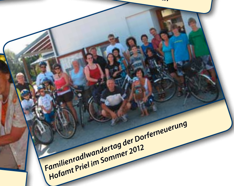
Familienradlwandertag der Dorferneuerung Hofamt Priel im Sommer 2012