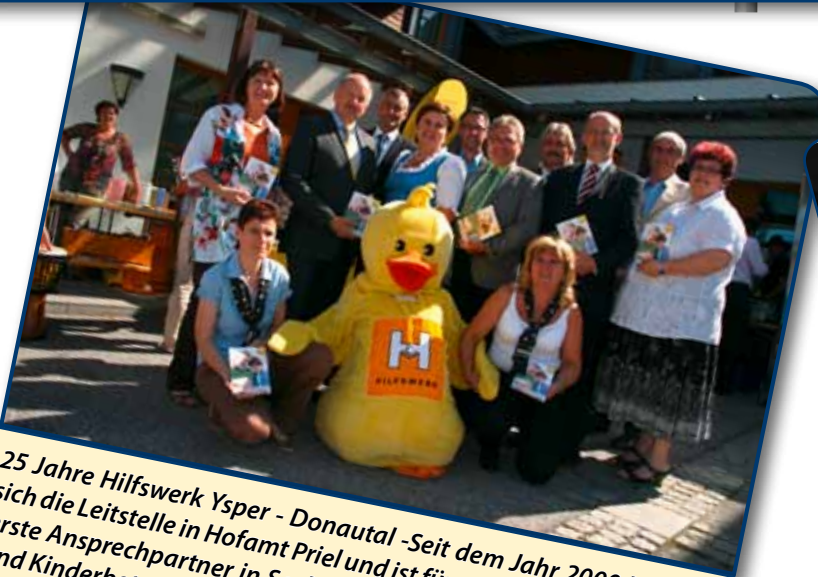
25 Jahre Hilfswerk Ysper - Donautal - Seit dem Jahr 2000 befindet sich die Leitstelle in Hofamt Priel und ist für unsere BürgerInnen der erste Ansprechpartner in Sachen Pflege, Hilfe daheim sowie Lern- und Kinderbetreuung