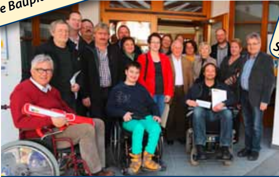
Barrierefreier Eingang für das Gemeindezentrum wird bei der Dorfbegehung beschlossen und auch umgesetzt!