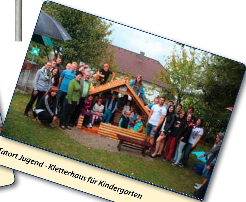
Tatort Jugend - Kletterhaus für Kindergarten