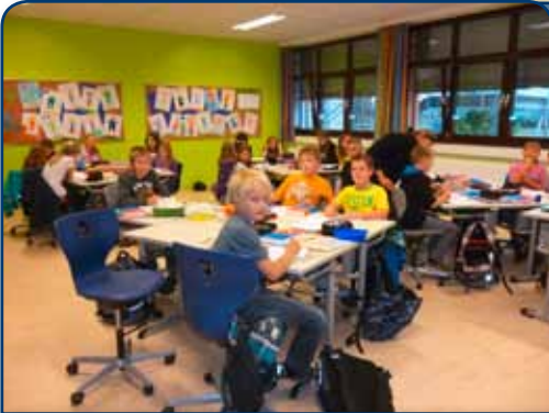
Hauptschule Persenbeug - moderne Klassen, neue Fassade...