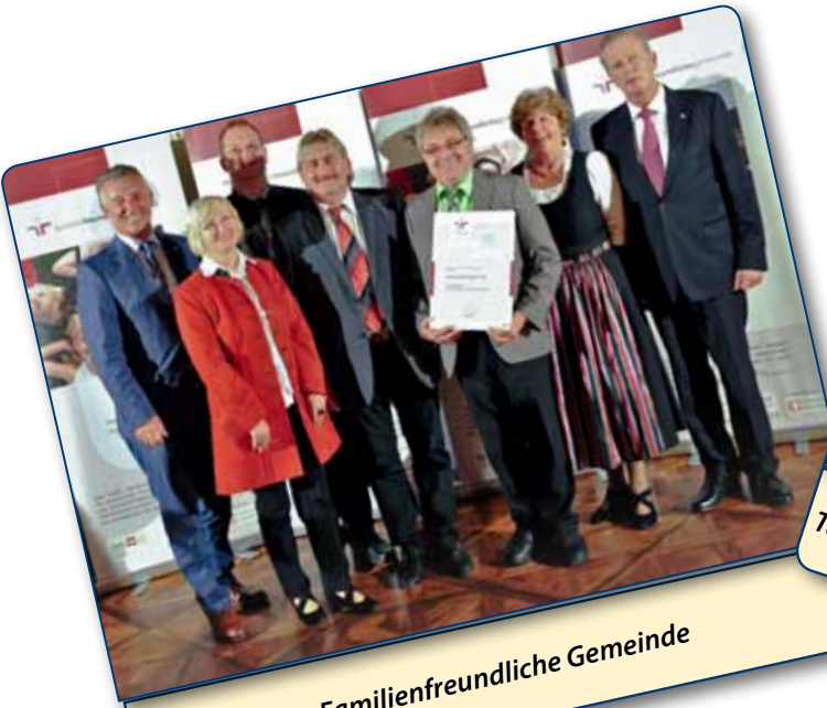
Auszeichnung Familienfreundliche Gemeinde