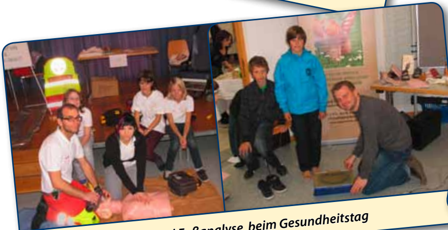
Erste Hilfe Vorführung und Fußanalyse beim Gesundheitstag