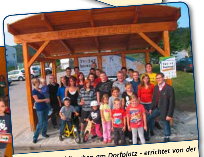
neues Buswartehäuschen am Dorfplatz - errichtet von der Landjugend