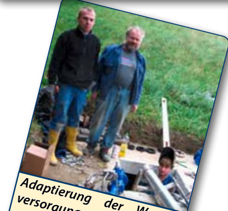
Adaptierung der Wasserversorgungsanlage auf den neuesten Stand der Technik Einbau der neuen Druckreduzierer - Kostenaufwand 30.000 Euro