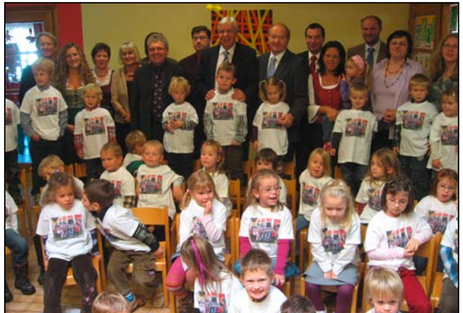
Der Kindergarten wurde am 25. Oktober feierlich eröffnet

Zu einem gelungenen Fest bei herrlichem Sonnenschein wurde die Eröffnung unseres Kindergartens.