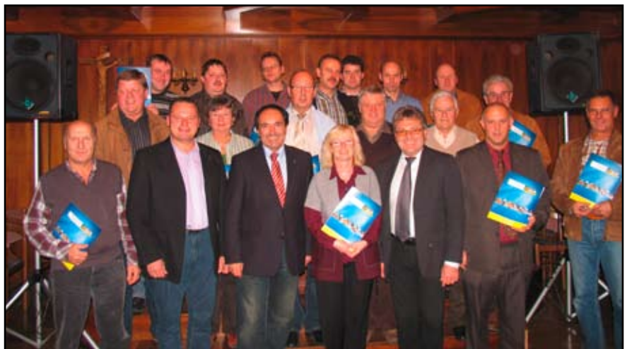
AK Vizepräsident nahm die Mitgliederehrungen vor

Ein roter Streit- hansl im Land ist genug!