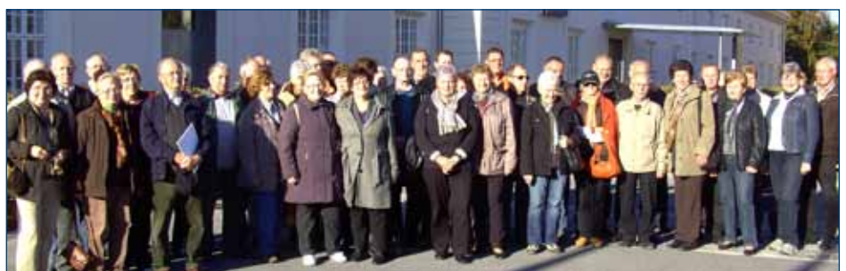
24 Teilnehmer unserer Ortsgruppe waren bei der Fahrt des Teilbezirks zur Landesausstellung nach Carnuntum dabei

An der Fahrt des Teilbezirkes ins Römerland Carnuntum nahmen am 17.10. ebenfalls 24 TeilnehmerInnen unserer Ortsgruppe teil. Alle waren sehr beeindruckt vom Freilichtmuseum Petronell mit prächtigen Villen und einer originalgetreu nachgebauten römischen Therme. In Hainburg wurde Teil II der Ausstellung in der Kultur-Fabrik (ehemalige k.u.k. Tabakfabrik) besichtigt.