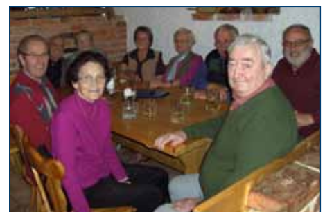
Seniorenstammtisch am 13.10. beim Mostheurigen Eder