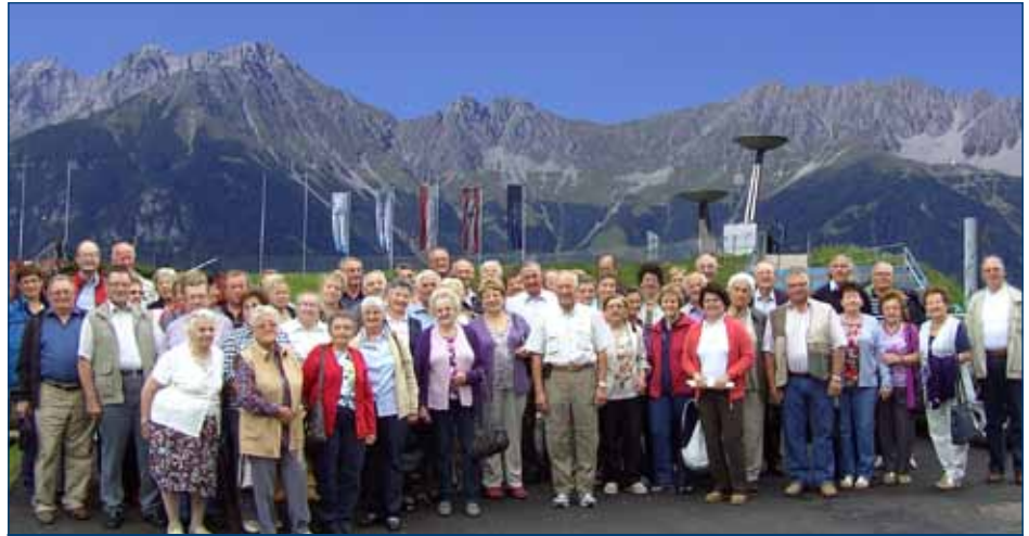
4-Tages Sternfahrt nach Tirol

Die 4-Tagesfahrt unserer Ortsgruppe wurde vom 28. – 31.08.11 gemeinsam mit dem SB Yspertal durchgeführt. 30 Senioren unserer OG verbrachten 4 schöne Tage im Stubaital. Am Programm standen: die Bergiselschanze, das Rundgemälde, Besichtigung von Innsbruck mit Glockengießerei Grassmaier, Patscherkofel, Stubaital, Kinderdorf Imst, Kühtai, Sellrain, Pitburgersee, und das alles bei schönem Wetter. Heimwärts ging es mit einer Besichtigung des Stiftes Benediktbeuern und einem Mittagessen in Bad Tölz.