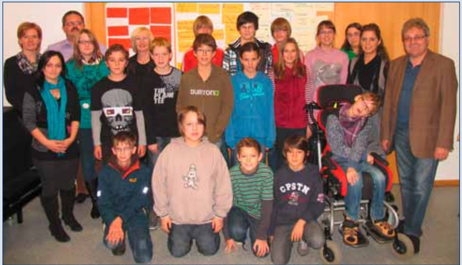
Aktionen im Rahmen vom Familieneaudit: Schülerparlament im Gemeindezentrum und Wunschboxen in der Volksschule

Geschmacklos und beleidigend für uns alle war die Schlagzeile „Hofamt Priel unser Griechenland“ im Bezirksblatt. Obwohl der Redakteur wusste, dass wir nur endfällige Kredite haben und auf der anderen Seite in Tilgungsträger ansparen, ist es eine unzumutbare Art und Weise die Ansparungen in der Beurteilung nicht zu berücksichtigen. Bei einer Berechnung unter Berücksichtigung der Tilgungsträger liegen wir hinter den genannten Gemeinden (Schollach, Dunkelsteinwald, Münichreith-Laimbach, Maria Taferl). Wenn wir