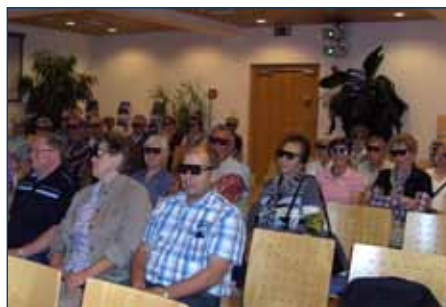
3-D Filmvorführung in Dürnrohr

Zur Müllverbrennungsanlage nach Dürnrohr fuhren am 29. September 44 Teilnehmer. Nach einem interessanten Lichtbildervortrag wurde das gesamte Werk besichtigt. Die gesamte Energie des Mülls wird zur Erzeugung von Strom und Fernwärme genutzt. Dürnrohr/Zwentendorf ist die größte und modernste Abfallverwertungsanlage in Österreich.