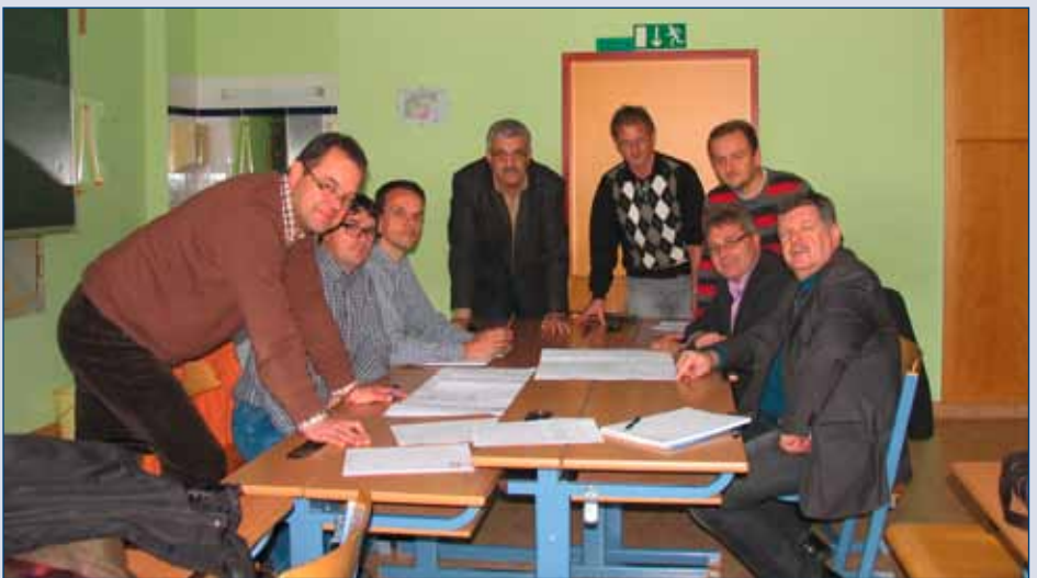
Generalsanierung Hauptschule: nach Abschluss der Außensanierung wird der Innenausbau und die Renovierung weiter geplant