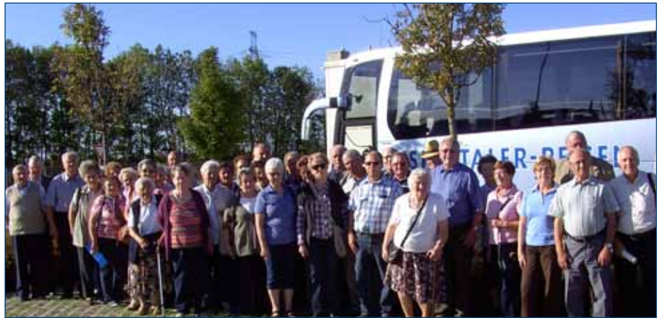
44 TeilnehmerInnen besichtigten die Müllverbrennungsanlage Dürnrohr

An der 3-Teiche-Wanderung am 12.9. gemeinsam mit dem SB Yspertal nahmen 27 TeilnehmerInnen unserer Ortsgruppe teil. Am Biobauernhof Dangl in der Höf wurden wir köstlich bewirtet.